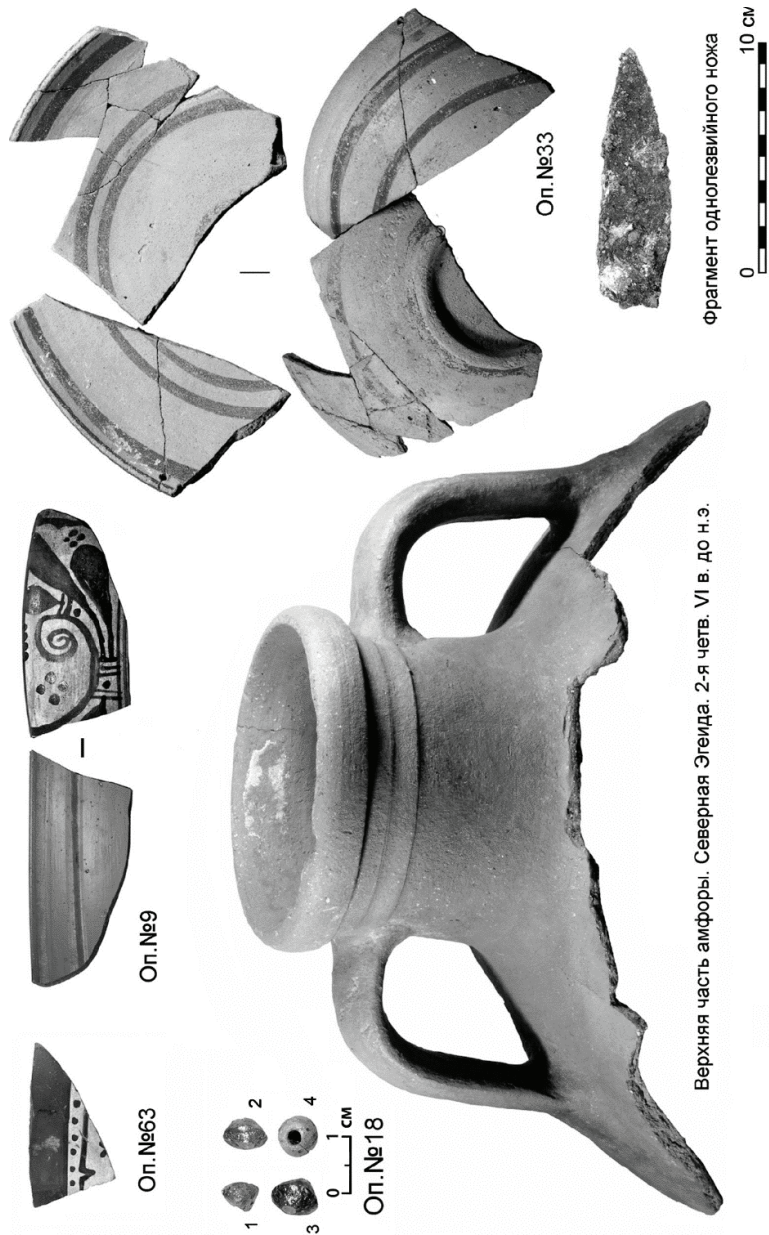
Рис. 2. Комплекс находок из слоя заполнения котлована № 29