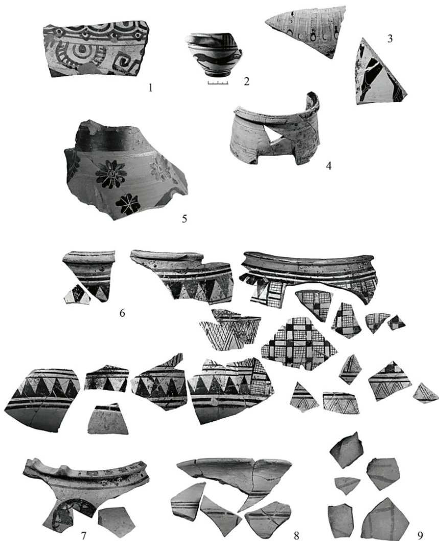
Рис. 5. Фрагменты расписной керамики из древнейшего слоя Пантिकाпея. 1. Сосуд круга мастера Лондонского диноса. 2. Протокоринфская котила. 3. Кратер с изображением гоплита. 4. Пиксида на трех ножках. 5. Расписная амфора мастера Горгон. 6. Динос с геометрическим декором. 7. Динос с геометрическим декором и выступами-ручками (?) по венчику. 8. Кратер с геометрической росписью. 9. Сосуды с неясным изображением