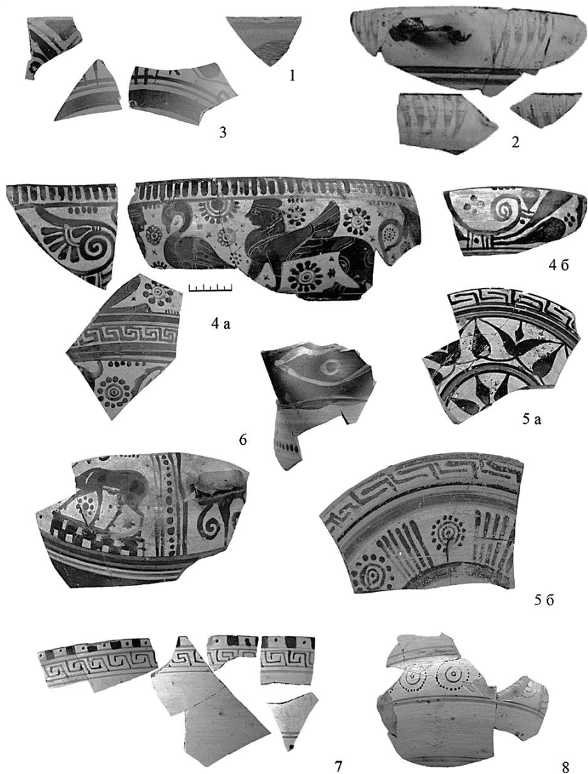
Рис. 4. Фрагменты расписной керамики из древнейшего слоя Пантикапея. 1. «Килик с птичкой». 2. «Килик с розетками». 3. «Килики с глазами». 4. Чаши с растительным завитком. 5. Расписные тарелки. 6. Сосуды с росписью в стиле Дикого козла. 7. Хиосский кубок "Grand Style". 8. Хиосский кубок "Group with dotted concentric circles"