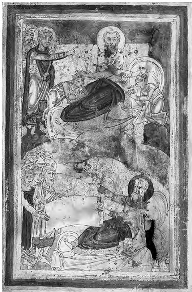
Илл. 2. Лист Витгерт, ок. 1150–1170 гг. Библиотека университета, Льеж, Ms. 2613 ( http://hdl.handle.net/2268.1/4796/ )