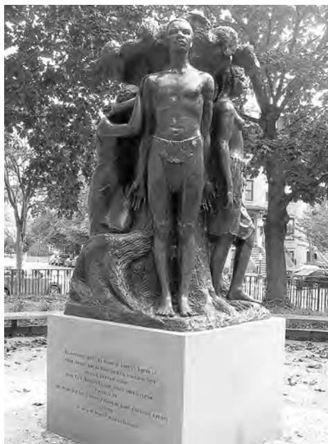
Илл. 1. Памятник «Освобождение рабов». Скульптор М.В.У. Фуллер. 1913 г. Бостон, Массачусетс.

ства и опыт черных американцев» 39 . Они несут послыл о «выдающемся положении белости» ( the prominence of whiteness ); через него эти монументы и сегодня оказывают подспудное, но ощутимое влияние на идентичность белых американцев 40 . За десять лет до начала «войны памятников» Дж.Р. Нефф утверждал, что значение памяти о сражавшихся и погибших на Гражданской войне в значительной степени игнорировалось общественным сознанием, а в научной литературе отсутствовал анализ того, как различные формы коммеморации жертв войны Севера и Юга до сих пор служат средствами для выражения и сохранения одной из давних линий раскола в американском социуме 41 .