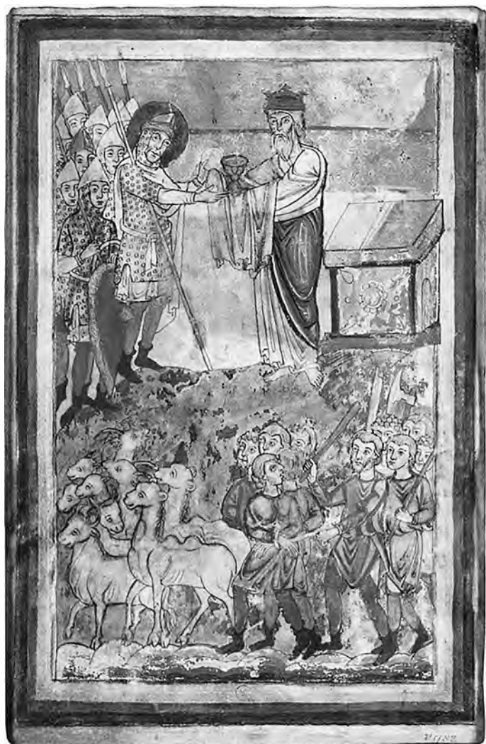
Илл. 4. Лист с сюжетными композициями, ок. 1150-1170 гг. Музей Виктории и Альберта, Лондон, Ms. 413 ( https://collections.vam.ac.uk/item/O125624/manuscript-cutting-unknown/ )